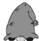
s' Blochinger Wichtele e.V.

Am Mittwoch, den 06. Dezember 2023 kommt der Nikolaus zu uns nach Rosna. Wir treffen uns um 17 Uhr im Hof der Habsthaler Straße 19/1. Zur besseren Planung bitten wir um Anmeldung der teilnehmenden Kinder. Dafür wurden bereits Anmeldungen in die Briefkästen verteilt. Bitte Becher oder Tassen mitbringen und wer möchte selbstgebackene Plätzchen. Über Mithilfe beim Aufbau ab 16 Uhr oder beim Abbau nach der Veranstaltung würden wir uns sehr freuen. Dafür könnt ihr euch gerne unter Tel.: 07576/9294688 melden.